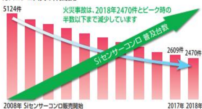
ガスコンロ火災の件数推移

Siセンサーコンロは既に住宅の60%に普及しています*。コンロ火災は、このSiセンサーコンロの普及と共に年々減少、このコンロに搭載された過熱防止機能や消し忘れ防止機能など安全機能が有効にはたらいっていると考えられています。